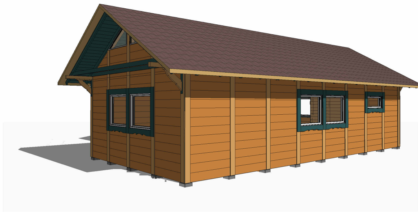
Skats 1 / View 1