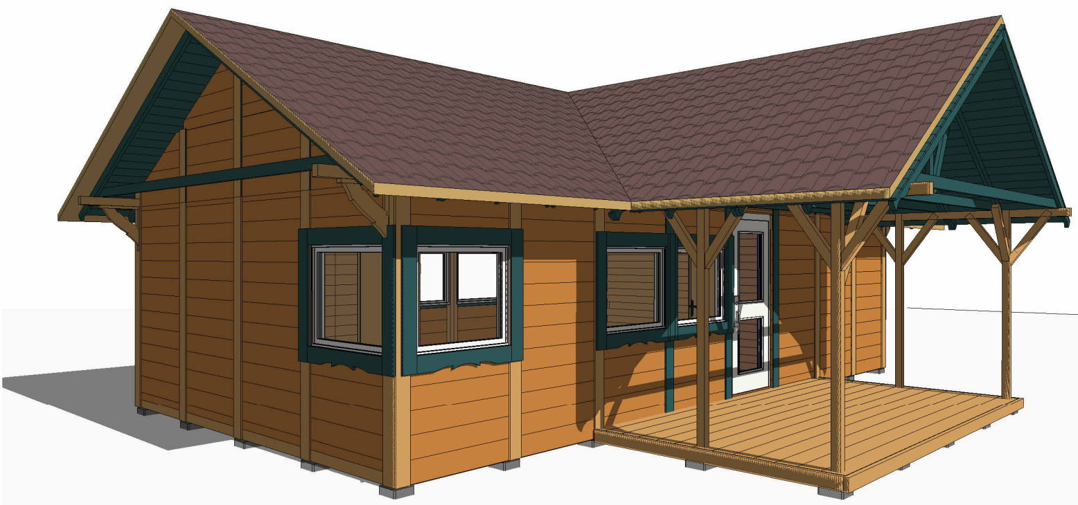
Skats 3 / View 3